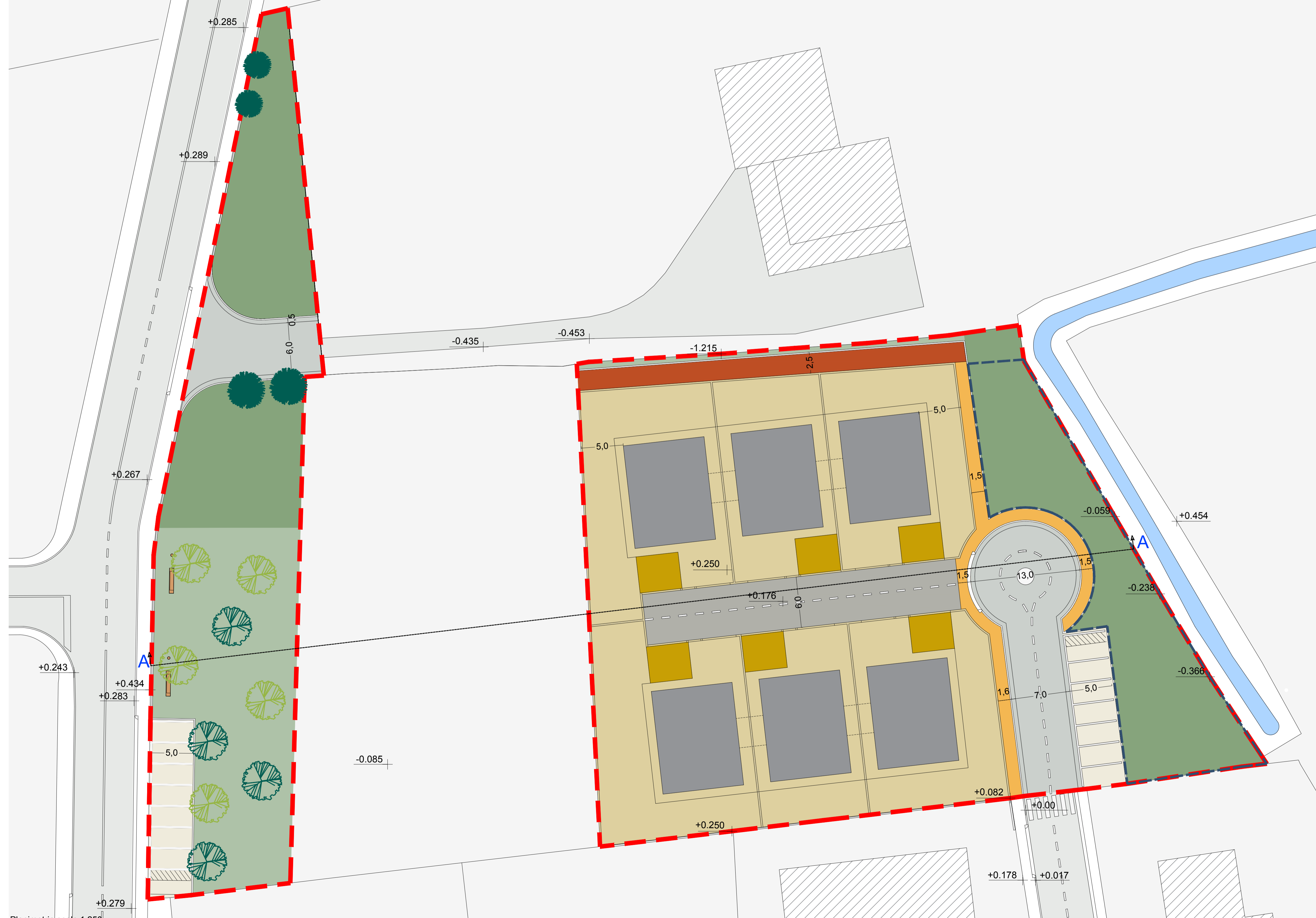
Planimetria scala 1:250